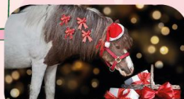
Promenades gratuites Poneys et Calèche Sam. 6, Dim. 14, Mer. 17 et Dim. 21 Déc. à 15h