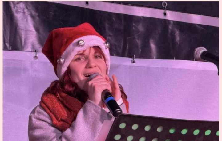
De nombreux concerts durant toute la manifestation avec des artistes du département de la Meuse.