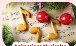
Animations Musicales Les Mer., Sam. et Dim. à 14h