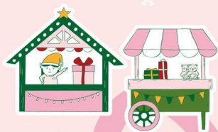
LE VILLAGE DE NOËL