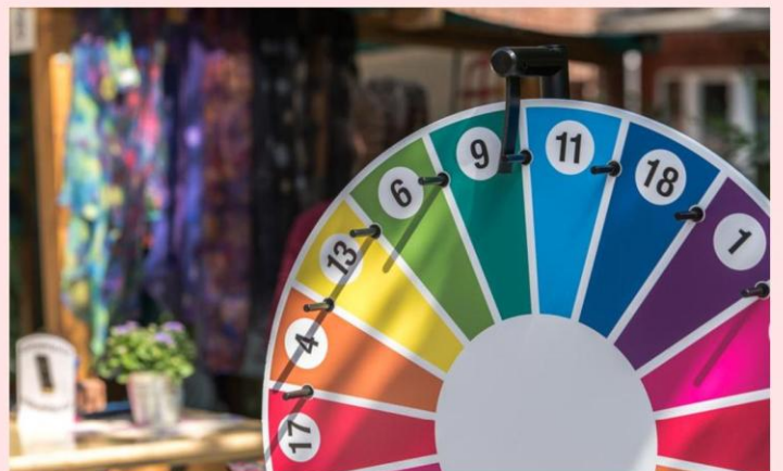
Des animations et de nombreux lots à gagner avec notre radio locale Meuse FM.