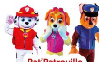
Pat'Patrouille Sam. 13 Déc. à 14h