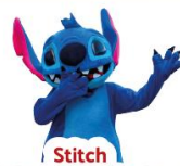
Stitch Mer. 3 et Mer. 24 Déc. à 14h