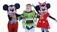
Mickey, Minnie et Buzz l'Éclair Mer. 17 Déc. à 14h