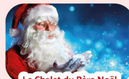
Le Chalet du Père Noël 10, 13, 14, 17, 20, 21, 22 et 23 Déc. à 14h