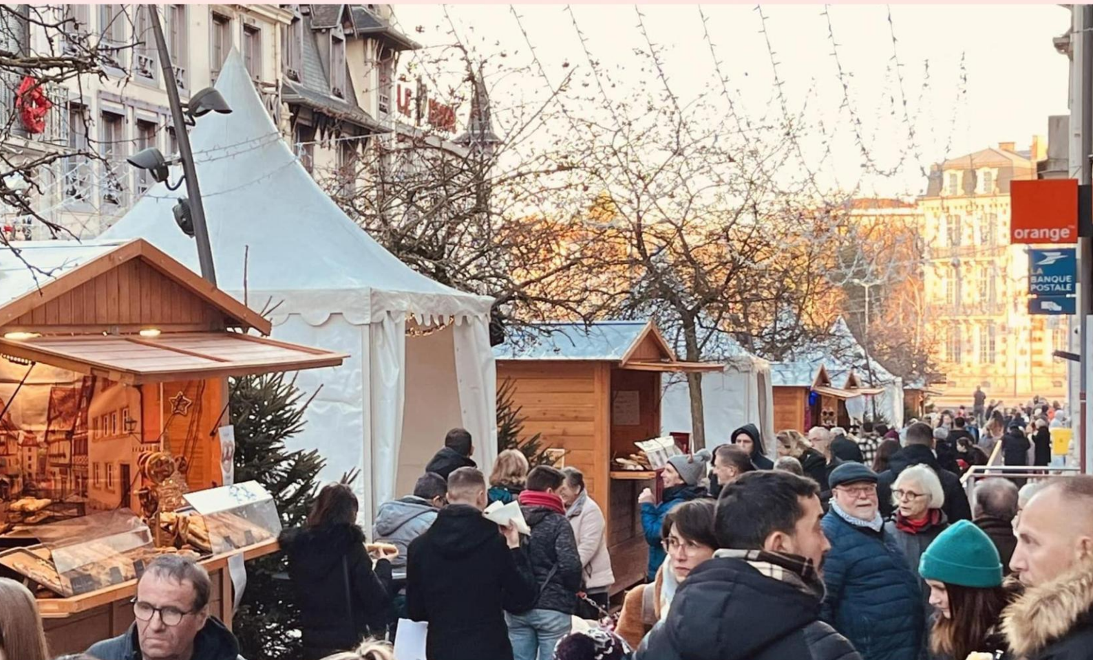
Le Village de Noël de Verdun, c'est le gage d'une manifestation féérique et festive de qualité pour un rendez-vous annuel familial avec de nombreuses animations.