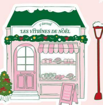
LES VITRINES DE NOËL