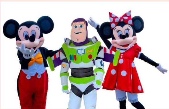
Une ambiance de folie avec la présence de nombreux personnages.