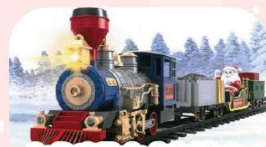
Le Petit Train de la Féerie Manège du Mer. 3 au Mer. 24 Déc.