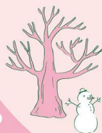
LE MARCHÉ DE NOËL