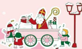
LE DÉFILÉ DE LA SAINT NICOLAS